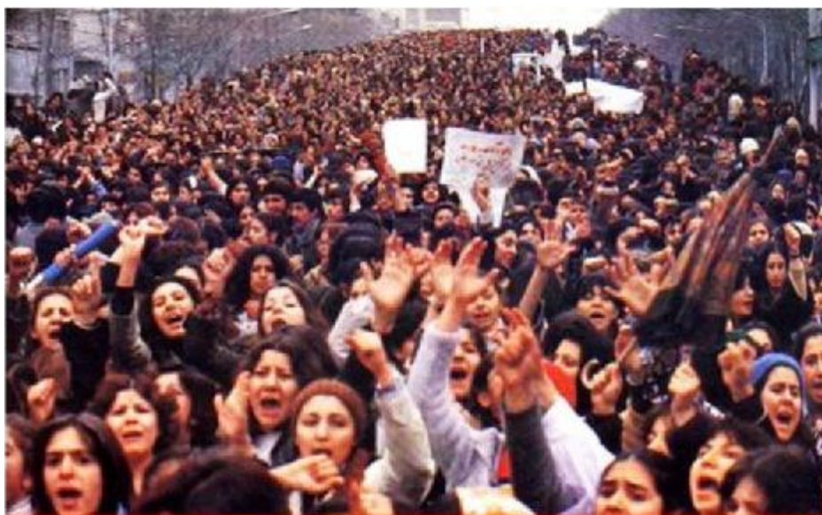
International Women's day demonstrators Tehran, March 8, 1979

فصلنامه زنان- شماره 19 (خرداد 1388- مه 2009)